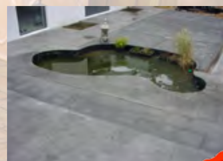
Lossingsprint met ingebouwde vijver

De diverse werkfasen in beeld bij Creteprint folie Print procedé