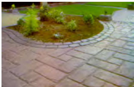
Tuinterras met motief van grote tegels (Folieprint)