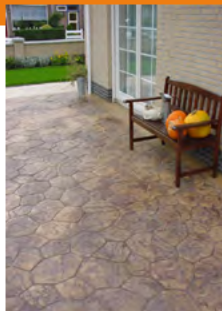
Terras met cumbrium motief (Folieprint)