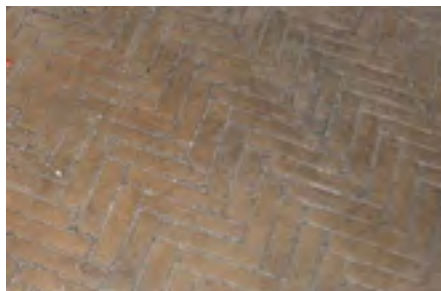
Oprit met de bekende 'visgraat' legging (Folieprint)